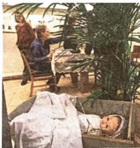
Ook leuk voor kleine gasten.